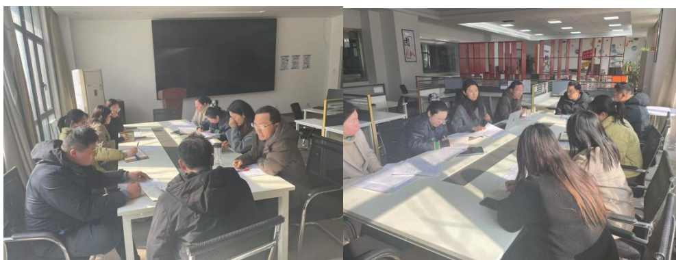
图 13: 教研室研讨人陪方案

智德针对人才培养计划建立多样性与选择性相统一的教学机制，通过具体的职业实践活动，帮助学生积累实际工作经验，突出职业教育的特色，使学生更好地理解电子商务的实际运作，提高他们的实践能力和解决问题的能力。