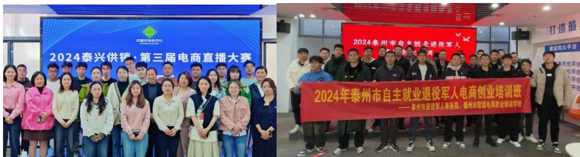
图 12: 地方培训服务

泰州智德有限公司本着“以服务求支持，以支持求发展”的理念，围绕泰州市退役军人事务局、泰兴供销社等相关社会组织进行专业电子商务专业知识辅导，成立学习培训小组，取得了丰硕的实战成果，有效发挥地方发展智库的作用。