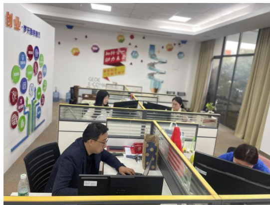
图 10：专职教师在泰职大办公中

合作以来，智德公司为了提升学院的整体教学水平和师资队伍，为学院组建了一支实战能力强的讲师团队，到目前为止培养了 12 名“实战型”企业教师，培养了 6 名学院专职教师。企业教师通过参加各种培养提升自身的理论教学水平。专任教师通过企业挂职锻炼，提高自身的实践工作能力。这支专兼结合的教学团队，不仅满足学院学生实践技能培养，还在服务社会，面向企业职工的在职培训提高、转岗培训方面发挥着重要作用。