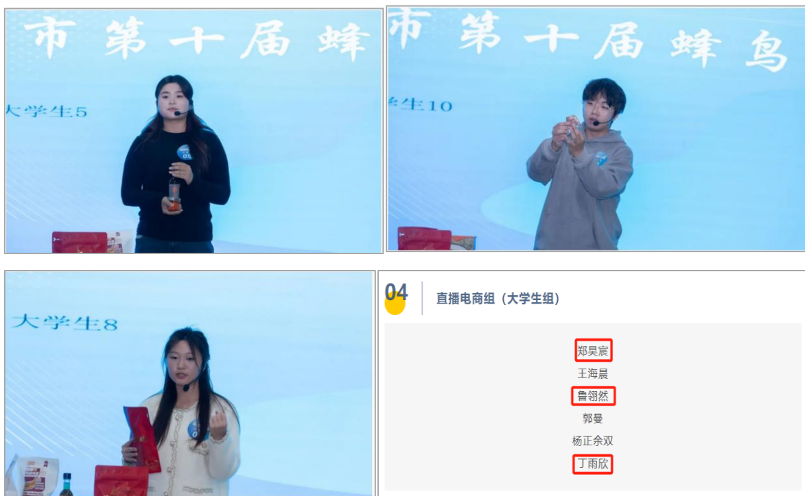
图 11: 参赛选手风采

为了准备此次比赛，企业指导教师团队——杨媛媛老师、钱华老师以及宗飞老师，在整个备赛期间给予了参赛学生全方位的支持与帮助。他们不仅提供了专业领域的知识讲解和技术培训，还针对每位选手的特点制定了个性化的成长计划，并通过模拟演练等方式增强学生的实战经验。此外，老师们还积极协调资源，为学生们创造更多实践机会，让他们能够在真实的商业环境中锻炼自我。